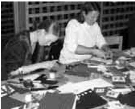
Mor og datter i dyp konsentrasjon på juleverksted. Under: Tria gledet oss med en gjennomarbeidet kabaret.

Og så var vi ikke helt ferdig med feiringen. Fredag 18. januar