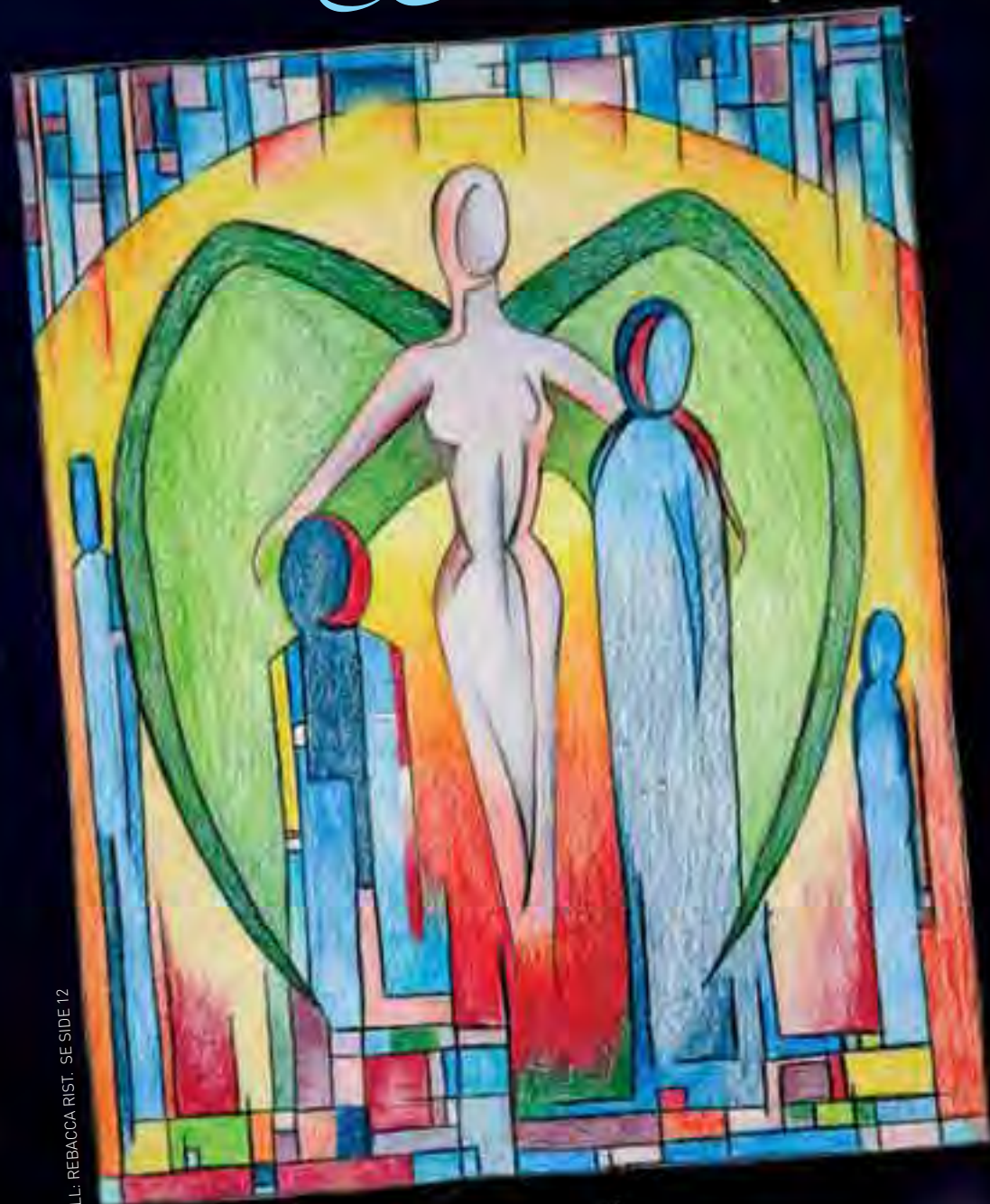
ILL: REBACCA RIST. SE SIDE 12

I tju år har Sigmund Aarvik (72) trofast invitert til bibeltimer hver siste tirsdag i måneden. Side 14-15