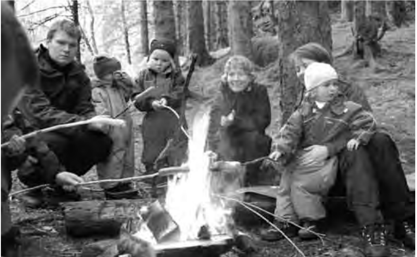
Koselig å være nyslått ekornspeider i Sædalens familiespeiding.