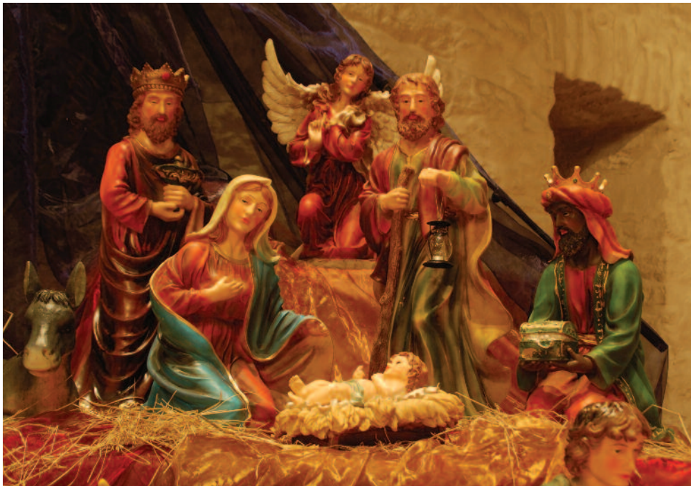
Julekrybben i Birkeland kirke.

ene skulle erstatte hedenske fester med et kristent innhold. Slik levde folkelige forestillinger og kristentro lenge side om side.