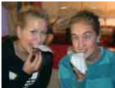
Snackpause hører med.