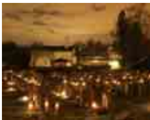
Lystenning på gravplassen ved Øvstun kapell.

Minnegudstjenesten vil være rundt tre kvar-