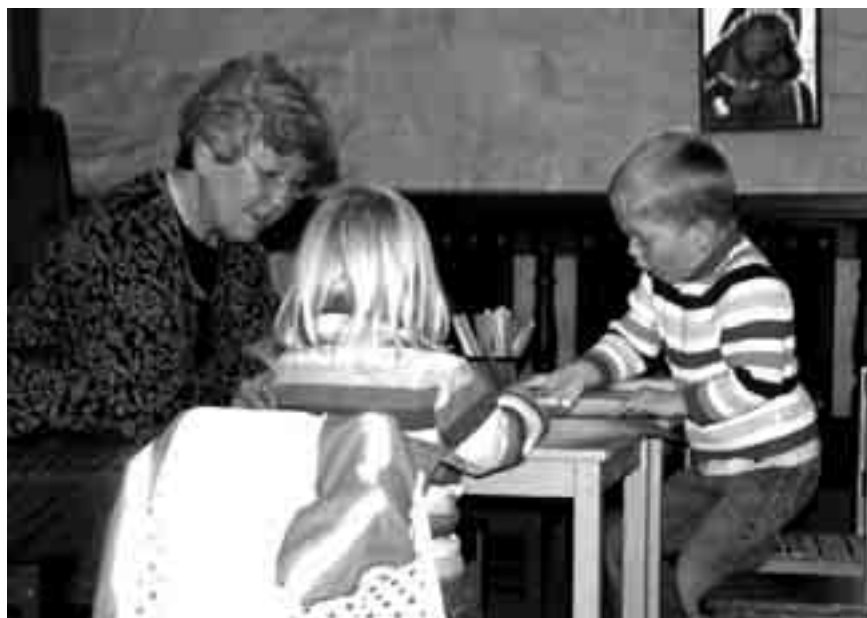
Barnekroken er et stille sted rundt et bord for barn og voksne - og med eget ikon og alter.

Når det er dåp kan barna gjerne komme fram og sitte i midtgangen slik at de kan se bedre når barna døpes. Familiegudstjenestene er ekstra tilrettelagt for at barn skal kunne følge med. Da kan man gjerne sette seg helt framme i kirka, og kanskje gå bak i barnekroken om det drøyer litt for lenge. Noen ganger er barnekorene med