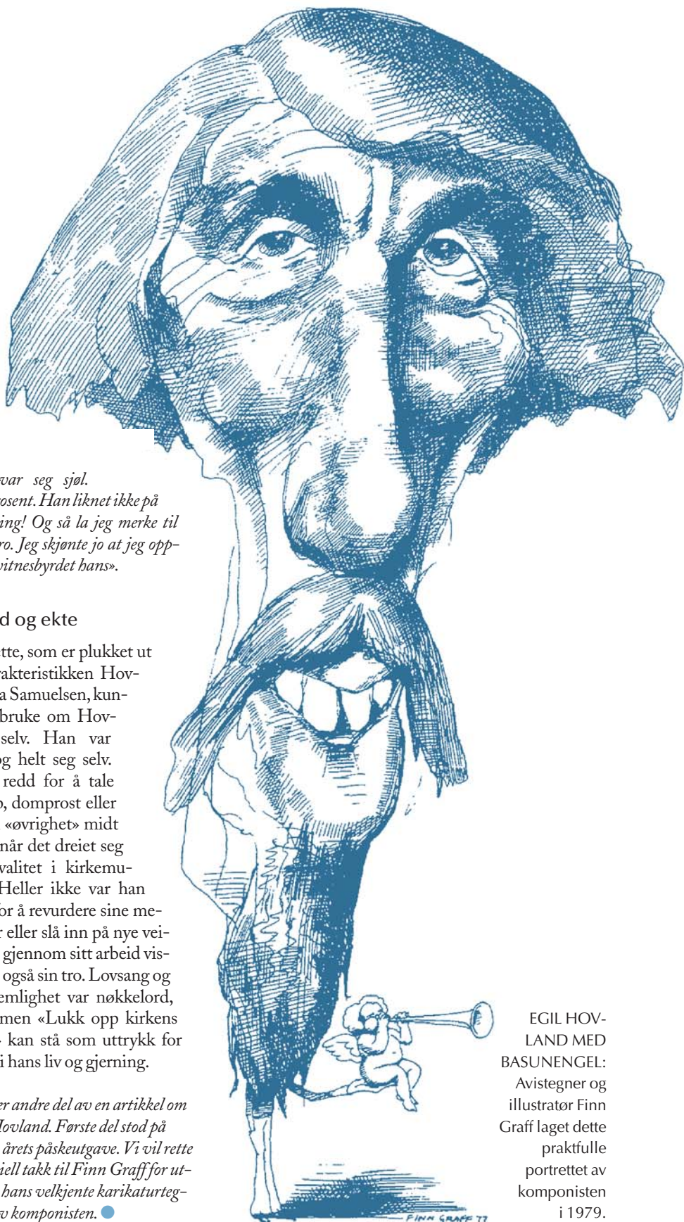
EGIL HOVLAND MED BASUNENGLER: Avistegner og illustratør Finn Graff laget dette praktfulle portrettet av komponisten i 1979.

Dette er andre del av en artikkel om Egil Hovland. Første del stod på trykk i årets påskeutgave. Vi vil rette en spesiell takk til Finn Graff for utlån av hans velkjente karikaturtegning av komponisten. ●