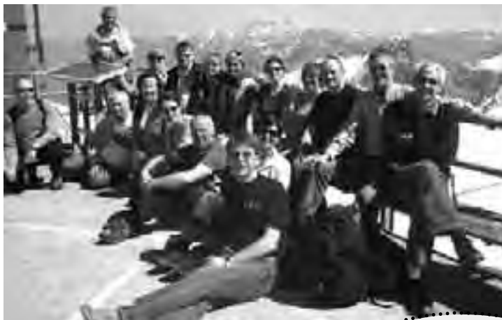
En fin gjeng nyter vårsolen i over 2000

innholdsrike borgen etter kart, med mange og tredve saler og rom og tårn – og overalt var det fantastisk akustikk til diverse sang-improvisasjoner. Det var lystig og herlig og andaktsfullt – alt på en gang. Så bar det ut i solen igjen, og rusletur tilbake mot byen.