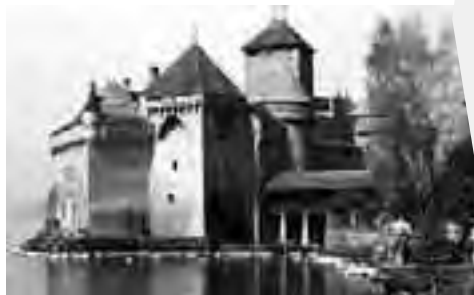
Chateau de Chillon er Sveits' mest besøkte turistattraksjon.