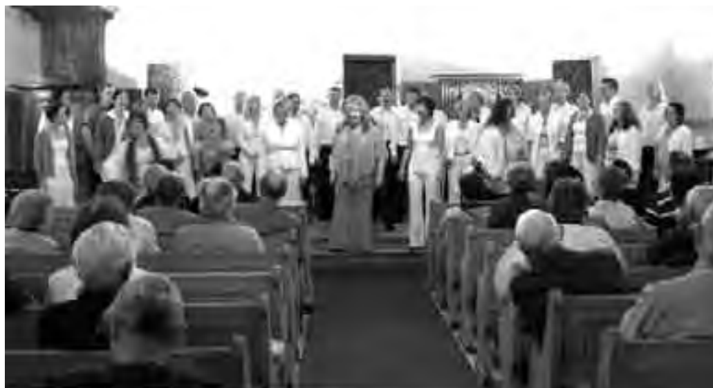
Sola Fide holdt separatkonserter i Abbey de Montheron utenfor Lausanne.

Vi bodde i Vevey, den lille nabobyen til Montreaux. Hotellet vårt, hotell de Lac, lå like