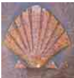
PILEGRIMENES SYMBOL: Kamskjell viste oss veien.

14 dager brukte vi på pilegrimsvandringen, med et par hviledager innimellom. Noen «fusket» litt og tok buss eller drosje litt av veien på de lengste etappene, men hele gruppen fikk sitt pilegrimbevis og kan heretter omtale seg selv som ekte peregrinere.