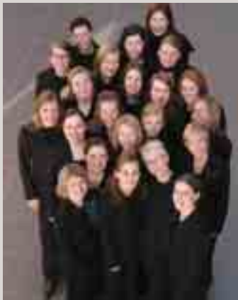
KORET: Voci Nobili anno 2004.

Voci Nobili består av vel 25 kvinnelige sangere. Norges beste damekor ble etablert i 1989 av Maria Gamborg Helbekkmo.