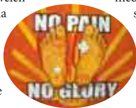
GNAGSÅR: Pilegrimenes adelsmerke.

plene hans ønsket å begrave ham i Spania, og brakte ham til provinsen Galicia i Nord-Spania. På 800-tallet ble graven gjenfunnet, og en kirke bygget på det stedet graven lå. Byens navn, Santiago de Compostela, kan oversettes som «Den hellige Jakobs gravsted». Hundretusener av pilegrimer har gjennom flere århundrer gått pilegrimsveien gjennom Frankrike og Spania til apostelen Jakobs grav for å se skrinet med hans levninger og for å motta den kraften og freden som denne vandringen gir. Vi føler oss ikke overbevist om sannhetsgehalten i sagnene om apostelen Jakob, og vi er heller ikke