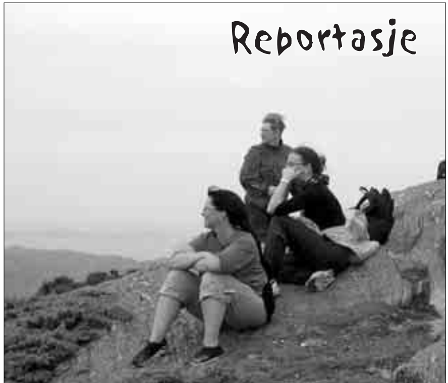
DOBBELT OPP: En fin tur er bra i seg selv, men kombinert med et humanitært prosjekt blir det dobbel gevinst!

Kapasitetsbyggingen er i hovedsak rettet mot lese- og skriveopplæring. En