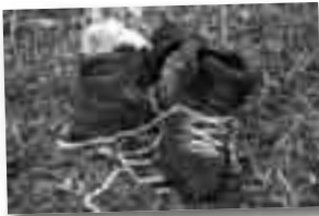
Hyssing gjør susen.