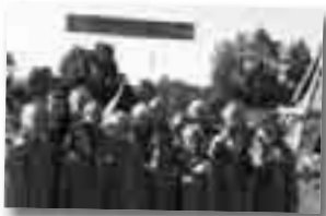
Jenter fikser alt.