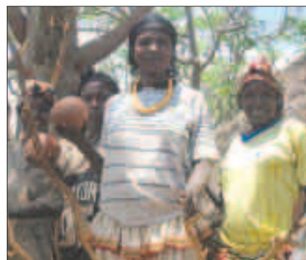
STOLTE, VAKRE, VENNLIGE: Jentene byr på fruktdrink i solvarmen.