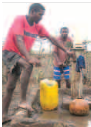
RENT VANN: Vannpumper fra Kirkens Nødhjelp gir folk en ny tilværelse

Likevel har jeg et ganske annet kjennskap til Kirkens Nødhjelps arbeid i dag. Det å personlig få møte mennesker som har fått nytt livs-