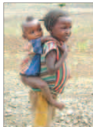
OMSORG: Han er ikke tung, han er jo min bror.

håp som et direkte resultat av dette arbeidet, gjør sterkt inntrykk. Jeg håper at inntrykkene, og den gnisten som ble tent i mitt møte med Afrika og Kirkens Nødhjelps bistands- og misjonsarbeid, i noen grad kan smitte over på konfirmante-